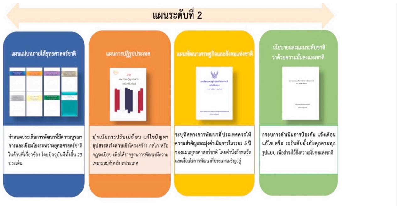
แผนภาพที่ ๒ แผนระดับที่ ๒

เป็นแนวทางในการขับเคลื่อนประเทศเพื่อให้บรรลุตามเป้าหมายของยุทธศาสตร์ชาติ ซึ่งกำหนดประเด็นการพัฒนา และถ่ายทอดไปสู่แนวทางในการปฏิบัติในแผนระดับที่ ๓ เช่น แผนแม่บทภายใต้ยุทธศาสตร์ชาติ ๒๓ แผนแม่บท แผนการปฏิรูปประเทศ ๑๓ ด้าน กรอบแผนพัฒนาเศรษฐกิจและสังคมแห่งชาติฉบับที่ ๑๓ นโยบายและแผนระดับชาติว่าด้วยความมั่นคงแห่งชาติ ดังแผนภาพที่ ๒ แผนระดับ ๒