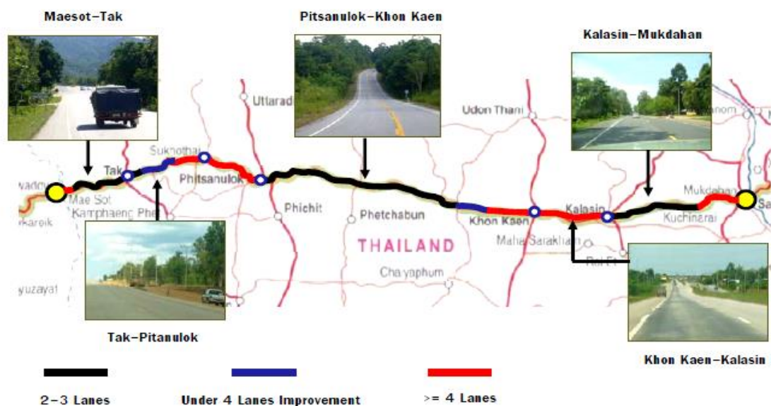
รูปที่ ๔ แนว East-West Economic Corridor ในประเทศไทย

โดยเส้นทางนี้เชื่อมโยงประเทศไทยกับสปป.ลาว ที่จังหวัดมุกดาหารโดยผ่านสะพานมิตรภาพ ๒ เป็นเส้นทางเศรษฐกิจสายใหม่ (ไทย-ลาว-เวียดนาม) ทำให้การค้าระหว่างประเทศเพิ่มขึ้นอย่างรวดเร็ว โดยเฉพาะอย่างยิ่งการค้าโดยการขนส่งทางบก ช่วยลดต้นทุนการขนส่งสินค้าให้สามารถแข่งขันได้และจะขยายผลไปสู่ประเทศจีนและญี่ปุ่น ซึ่งจะได้รับผลประโยชน์สูงมาก เนื่องจากสามารถขนส่งสินค้าจากประเทศไทยผ่านประเทศลาวไปสู่ท่าเรือน้ำลึกที่เมืองดานัง ออกทางทะเลจีนใต้สู่ประเทศไต้หวัน ญี่ปุ่นและเกาหลีใต้ได้ โดยมีระยะทางสั้นกว่าและใช้เวลาน้อยกว่าการส่งออกทางชายฝั่งทะเลตะวันออก (Eastern Seaboard) อันจะส่งเสริมให้มีการขยายปริมาณและประสิทธิภาพของการค้าชายแดนและการค้าผ่านแดนเพิ่มมากขึ้น