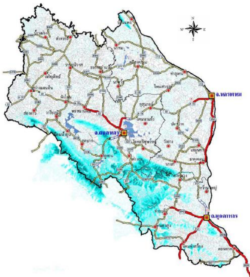
รูปภาพที่ ๑ กลุ่มจังหวัดภาคตะวันออกเฉียงเหนือตอนบน ๒